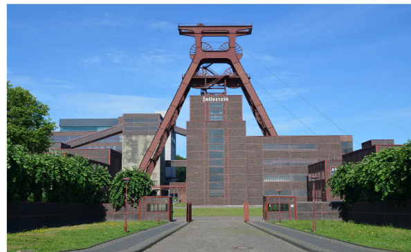
Zeche Zollverein, Essen

EUROPÄISCHE UNION: Investition in Ihre Zukunft - Europäischer Fonds für regionale Entwicklung.