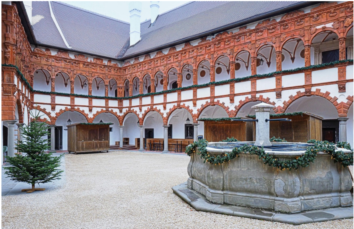
Terrakottaverzierungen im Innenhof der Schallaburg