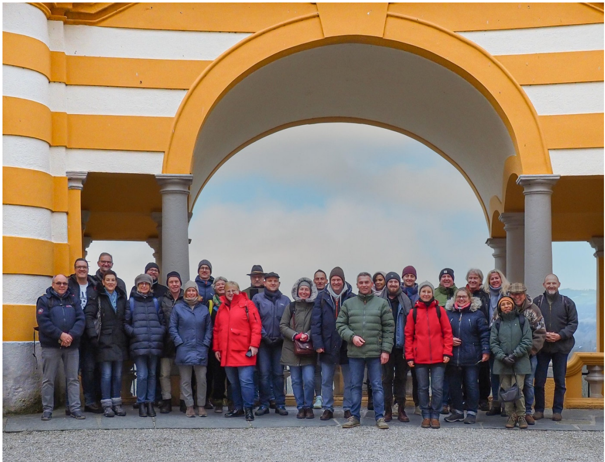
Gruppe im Stift Melk

Ende 2023 reisten Inhaber und Beschäftigte von 18 Handwerksbetrieben aus Hessen und der Pfalz nach Wien, um an einer besonderen viertägigen Veranstaltung teilzunehmen: Österreichische Experten mit unterschiedlichen Schwerpunkten im Bereich der Denkmalpflege führten die insgesamt 30 Teilnehmer aus verschiedenen Gewerken durch ausgewählte bedeutsame und denkmalgeschützte Objekte sowie eine Vergolderei. Dabei konnten die Handwerker viel Wissen und Hintergrundinformationen für den eigenen Betrieb mitnehmen. Erklärt wurde alles rund um Restaurierung und Denkmalpflege, die damit verbundenen Probleme und Herausforderungen – von theoretischen Überlegungen hinsichtlich der Sanierungskonzepte bis zu historischen Verarbeitungstechniken.